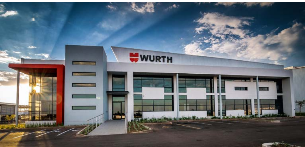
Wuerth South Africa (Pty.) Ltd. en Gauteng, Sudáfrica

Se debe aplicar especial cuidado a la hora de recopilar y procesar datos de carácter personal. Nos regimos por las leyes de protección de datos vigentes y nombramos cargos responsables de su cumplimiento.