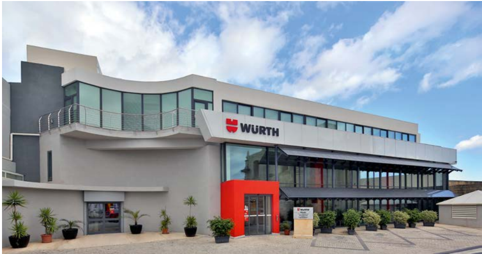
Würth Limited en Zebbug, Malta

Somos conscientes de que las restricciones mencionadas no solo se refieren a bienes físicos, sino también a información y tecnologías, las cuales tampoco se pueden transferir de forma ilícita. Las infracciones pueden provocar un gran perjuicio al Grupo Würth. Por ello se insta a todos los empleados a actuar con cautela y, p. ej., a no facilitar información por correo electrónico o por teléfono sin estar autorizados para ello. Nuestros empleados deben dirigir siempre sus dudas y consultas a los directivos o al responsable de la empresa.