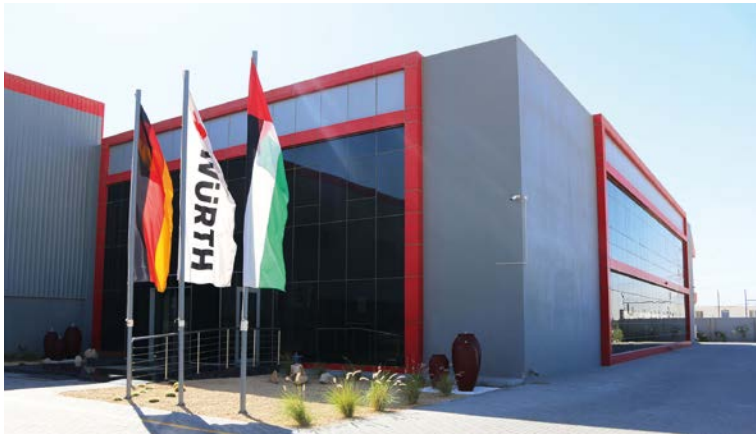
Würth Gulf FZE en Dubái, Emiratos Árabes Unidos

El Grupo Würth es consciente de que determinados recursos naturales son finitos. Por ello, tratamos de hacer un uso más responsable de los mismos desde el punto de vista ecológico. Esto no solo implica que respetemos las leyes en vigor sobre protección medioambiental y sostenibilidad, sino que también evitamos utilizar en la medida de lo posible los recursos no renovables cuando estos no sean necesarios. Se insta a todos los empleados a adoptar medidas razonables para reducir el desperdicio de los recursos y la contaminación medioambiental.