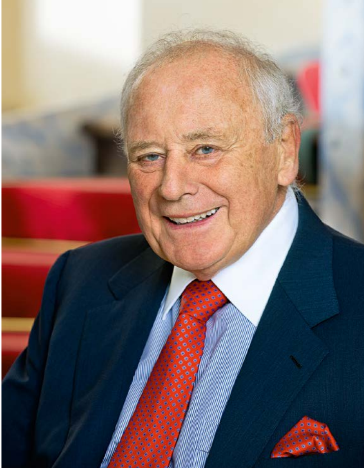
Prof. Dr. h. c. mult. Reinhold Würth, Presidente del Consejo de Administración de la Fundación del Grupo Würth, Presidente honorario del Consejo Asesor del Grupo Würth