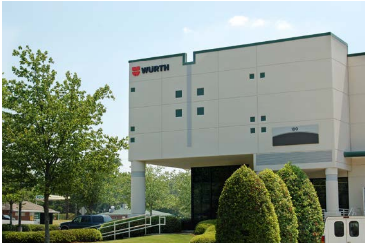
Würth Wood Group Inc. en Charlotte, EE. UU.

Se excluyen la escritura, las ponencias y actividades similares. Nos complace que nuestros empleados realicen voluntariados.