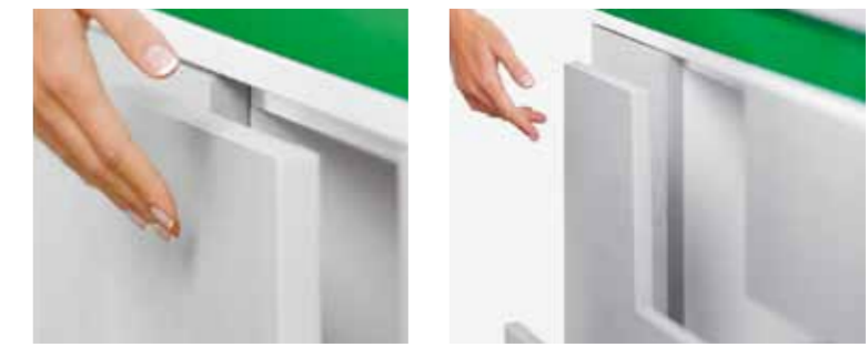
Kompatibilität mit allen GRASS Systemen ist die Basis für Funktions-Variabilität und Komfort.