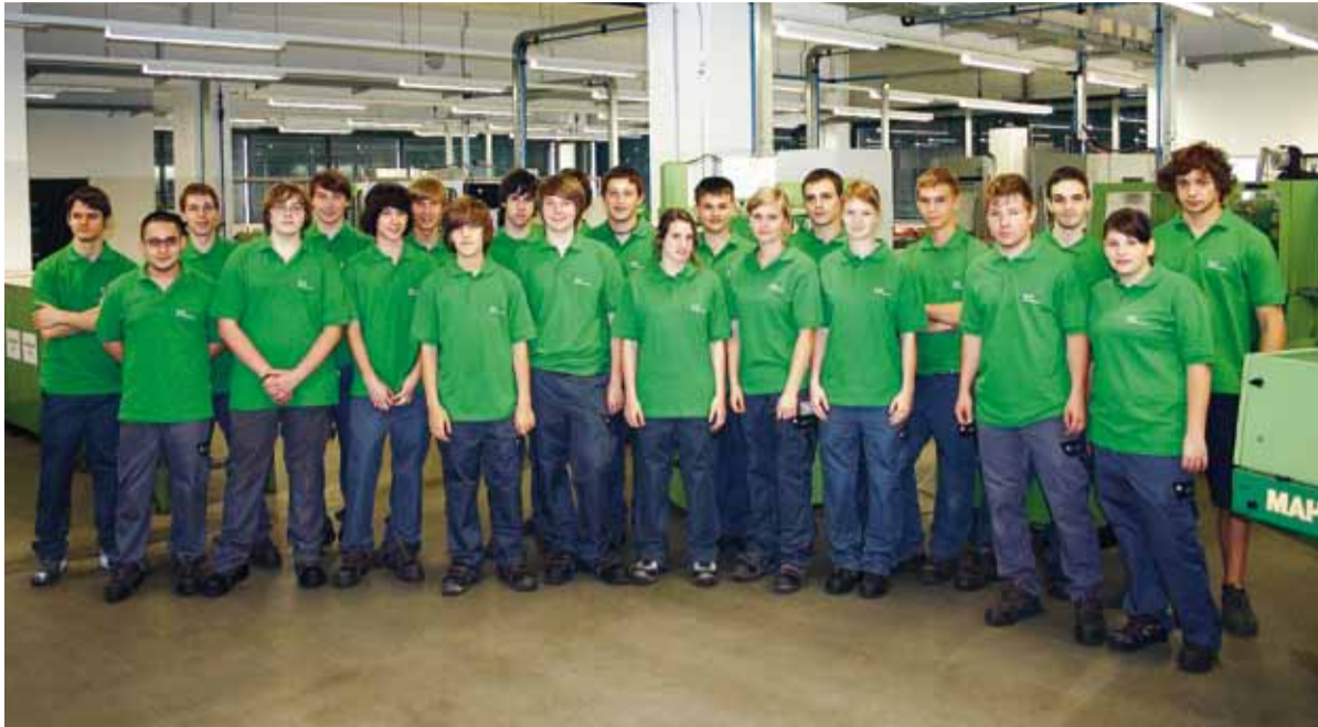
Fachkräfte von morgen: GRASS Lehrlinge zählen regelmäßig zu den Besten bei den Zwischen- und Abschlussprüfungen.

Mit einem Investitionsvolumen von knapp zwei Millionen Euro hat GRASS die hausinterne Lehrwerkstätte auf den neuesten Stand gebracht. Auf insgesamt 900 m 2 bietet GRASS seinen Lehrlingen beste Voraussetzungen für ihre Ausbildung zu Fachkräften in den Bereichen Metallbearbeitung, Maschinen- sowie Werkzeugmechanik. Bereits seit 1978 betreibt GRASS in Höchst eine eigene Lehrwerkstätte. Diese wurde nun im Zuge eines umfangreichen Modernisierungsplans – im April 2008 wurde am Standort Höchst eine neue, moderne Produktionshalle mit einem österreichweit einzigartigen Energiekonzept in Betrieb genommen – auf den neuesten Stand gebracht: So stehen den 65 Lehrlingen, davon sieben Mädchen, klimatisierte Räumlichkeiten für