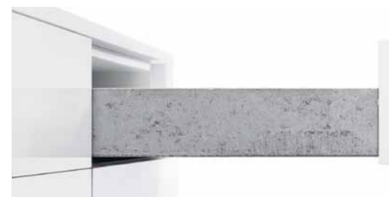
Das Unterflurführungs-System „hat Flügel“, kann schwere Lasten tragen und gleitet trotzdem geschmeidig und stabil in seiner Bahn.

kein Widerspruch. Möbel sind Ausdruck von Persönlichkeit und Lebensstil. Zweckmäßigkeit muss ein integrierter Bestandteil von Schönheit sein. Das bestätigt auch eine aktuelle Studie in Deutschland. 83% der Befragten legen Wert auf Zweckmäßigkeit und Funktionalität, 68% sehen ihre Einrichtung als Ausdruck ihres Lebensstils, 66% als Ausdruck ihrer Persönlichkeit und 54% als Ausdruck von Kreativität. Zusammenfassend sagt Andreas Fleischmann: „Wir haben uns Schritt für Schritt jedem einzelnen Bedürfnis unserer Kunden gewidmet, um in Summe das große Ziel zu erreichen – den Möbelherstellern eine einzigartige und ausgereifte Plattform für rationalen, kreativen Möbelbau zu bieten.“