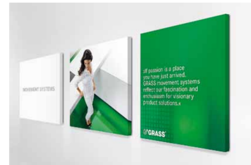
Der neue Markenauftritt wird konsequent in der gesamten Unternehmens- und Produktkommunikation realisiert.