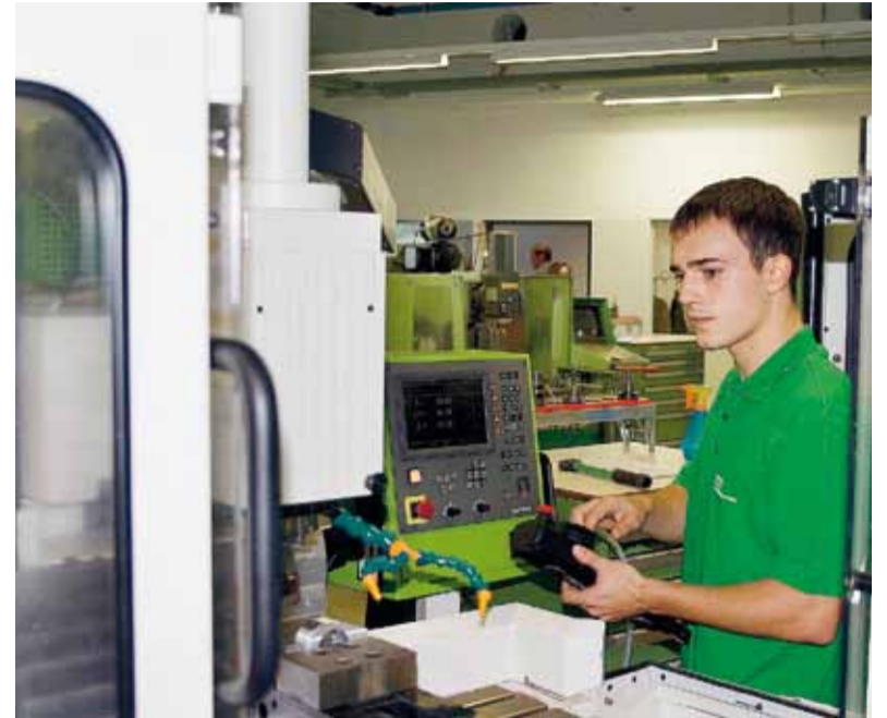
Die neue Lehrwerkstätte mit ihrer modernen Ausstattung bietet ein ideales Umfeld.

Lehrlingsprämie und Karrierechancen. „Bestens ausgebildete Fachkräfte sind eine wichtige Basis für