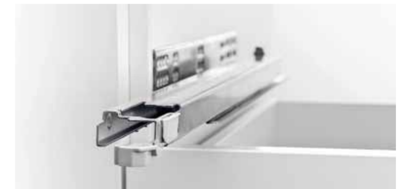
Durch die Synchronisation gibt es kein gefühltes „Holpern“, keinen Zwischenschlag wie bei herkömmlichen Systemen.

„Durch Funktionalität und Komfort wird Schönheit zu einem ganzheitlichen Begriff.“