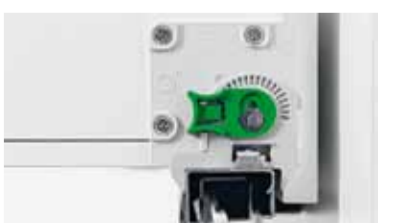
Die 3D-Verstellung macht Dynapro zu einem höchst wirtschaftlichen Bewegungs-System für die Zukunft.