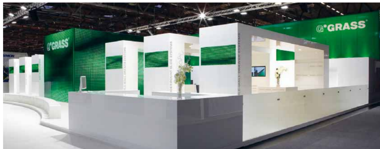
GRASS Messestand auf der Interzum. Ein futuristischer Tempel nach antikem Vorbild.

Ein Messestand als begehrte Visitenkarte mit Erlebnispotenzial. Ziel war eine emotionale Präsentation der neuen Marke GRASS und ihres erweiterten Sortiments an funktionalen Bewegungs-Systemen. Drei neue Produktlösungen und die praxisnahe Anwendung bereits etablierter Serien galt es in den Fokus zu rücken. Gleichzeitig sollte durch eine unverwechselbare Standardarchitektur ein klares Zeichen mit Wiedererkennungswert geschaffen werden. Die Umsetzung übertraf alle Erwartungen: Angefangen von der einladend offenen Architektur,