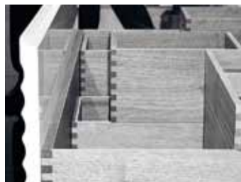
Hochwertiger Auszug mit Dynapro.

Dynapro Designtrends auf der Küchenmeile A30. Die Aussteller auf der Küchenmeile prägen aktuelle Designtrends. Da kam die absolute Gestaltungsfreiheit mit GRASS Dynapro gerade recht.