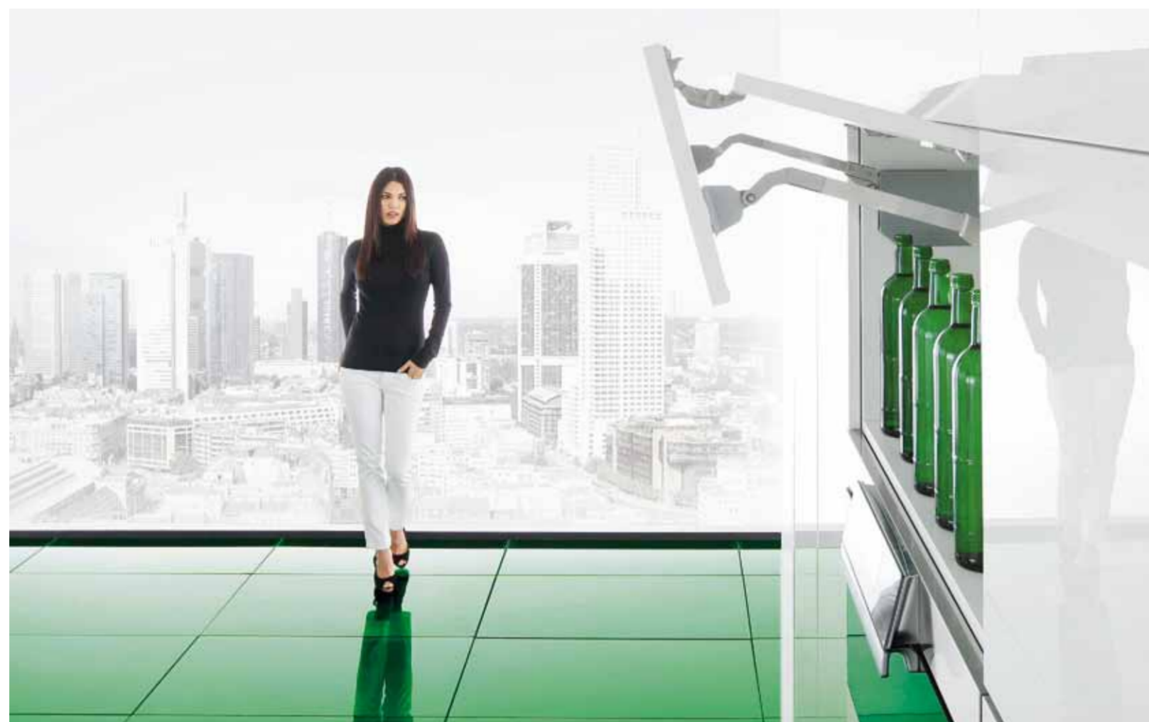
Leichtes Öffnen, müheloser Zugriff zum Schrankinneren und sanftes, geräuschloses Schließen. Kinvaro Klappen-Systeme von GRASS sind ein Ausdruck moderner Wohnkultur.

der elektronischen Klappen-Systeme einläuten. Passend zur weit fortgeschrittenen Elektrifizierung der Bewegung in der Küche, gilt nun auch im Oberschrank der Komfortgedanke. Beide Systeme lassen sich aus Sicht der Industrie und des Handwerks problemlos verarbeiten.