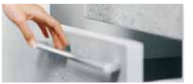
Täglicher „Luxus“. Das leichte Öffnen und sanfte Schließen von Dynapro.