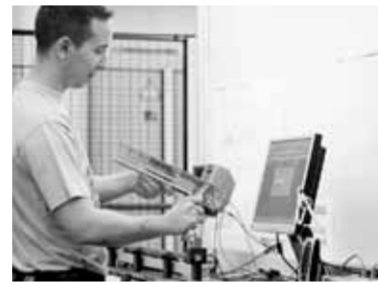
Messstation in der neuen Halle

das System Dynapro. Und manche nicht eingeweihten Mitarbeiter fragten sich, was hinter dem Code „MAG 100“ steckt (Mepla-Alfit-Grass 100). Noch mehr fragten sich, was die Produktmanager, Entwickler, Techniker, Marketing- und Vertriebskollegen beider Unternehmen