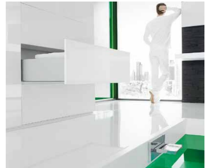
Mit Dynapro bewegen sich die Führungsschienen ohne störende Geräusche und Widerstände. Damit ist das Führungs-System geradezu prädestiniert für den Einsatz in Wohnmöbeln.

bei leichtem Antippen öffnen. Und mit Sensomatic, dem elektromechanischen Öffnungs-System, öffnen sich Dynapro-Schubkästen fast wie von selbst. In Verbindung mit diesen außergewöhnlichen Bewegungs-Systemen garantiert Dynapro höchsten Bedienungskomfort.