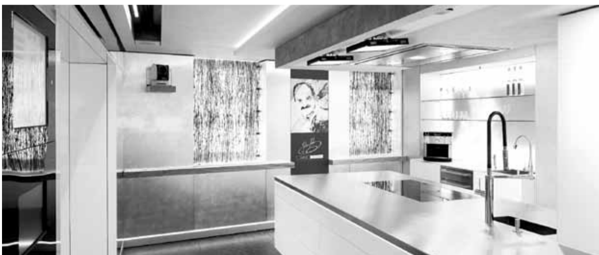
Die neue Küche Johann Lafers: Modell Design ART PICCO Filigrano TIPTEC SENSOTRONIC.