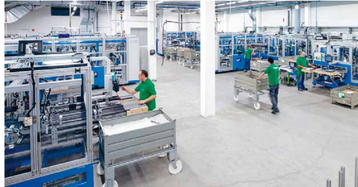
Dynapro Produktionsstraße mit modernsten Montageautomaten.

Die Entwicklung von Dynapro ist in mehrfacher Hinsicht ein Meilenstein. Für Möbelhersteller ist Dynapro ein Unterflurführungs-System, das es in dieser Form noch nie gab, ein System mit einzigartigen, ja begeisterten Nutzen. Aus der Sicht von GRASS und den Mitarbeitern ist Dynapro noch etwas anders, ein Symbol für die Verwirklichung einer Vision. Da ist einmal die Projekt- und Produktentwicklung von 2005 bis zur Marktreife – als Schlüsselprozess im Zusammenwachsen der damaligen Unternehmen Mepla-Alfit und GRASS zur heutigen GRASS Gruppe. Und da ist die Konzeption und Realisation eines neuen Fertigungsprozesses, an dem gleich vier Standorte beteiligt sind, inklusive Errich-