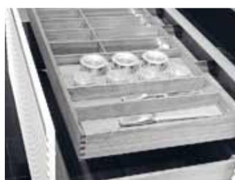
Innenschubkasten mit Dynapro.

Namhafte Markenhersteller wie Allmillmö, Bax-Küchen und Zeyko nutzten die Vielfalt und das Differenzierungspotenzial von Dynapro, um ihre individuellen Gestaltungen zu verwirklichen. Zu sehen war das Unterflur-System unter anderem mit Soft-close Dämpfung, mit Tipmatic Plus und mit Sensomatic Öffnungs-System. Die Aussteller zeigten sich mit der Messe und der Performance von Dynapro höchst zufrieden. Sie werden die neue Unterflurführung ab Dezember in ihren neuen Modellen einsetzen.